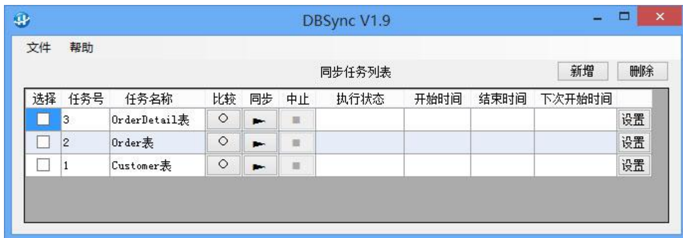
图 2：DBSync 主界面

说明：DBSync 以表为单位进行同步，一个任务负责一对数据表之间的同步，多个表的同步就要设置多个任务，任务可并发执行。默认设置了 3 个任务，您可以直接执行，以体验同步方式与效果。