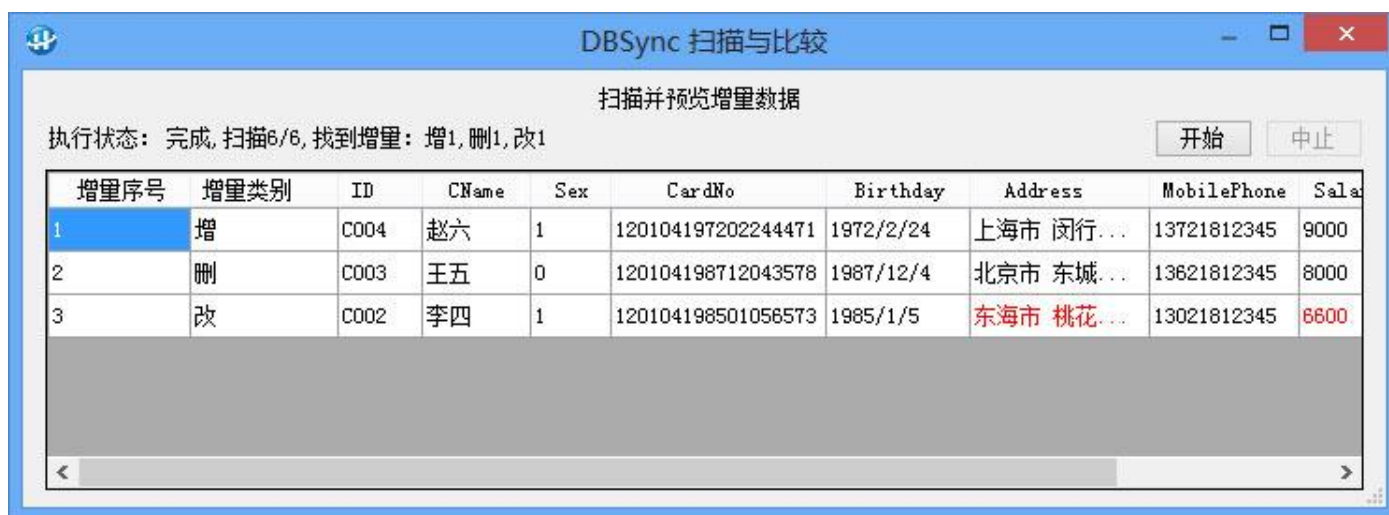
图 7：扫描与比较双方数据

设置好同步任务后，Click 任务列表中的“○”按钮，进入扫描与比较界面，如下图所示：